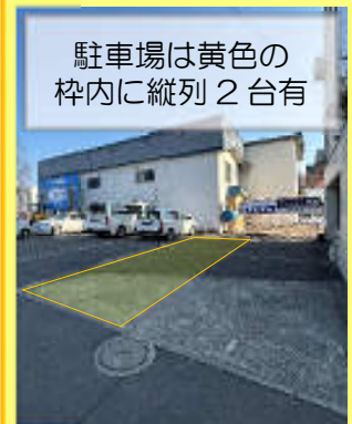
駐車場は黄色の枠内に縦列2台有