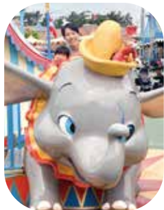
娘も一日いっぱい楽しみました