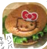
ハンバーガーにもキティちゃん