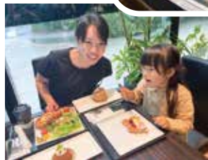
スイーツとフレンチトーストのランチを食べました！