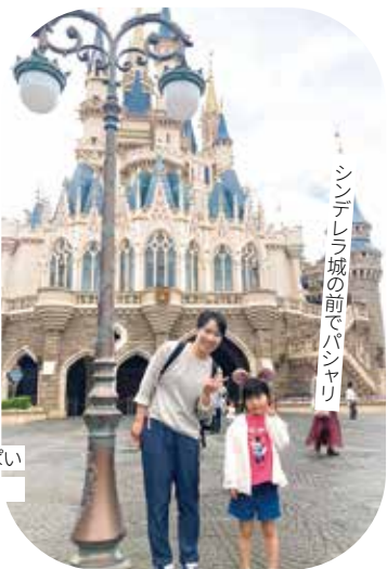
シンデレラ城の前でパシャリ