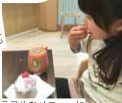
カラフルなメニューにテンション上がる！

夫 は仕事のため、私と5歳の娘と姉の3人で3泊4日の東京観光へ。コロナ明けでダンサーが久しぶりに登場するという、ディズニーランドのパレードを楽しみにしていました。娘も「夢が叶った！」と大喜び。また、娘が行きたかったサンリオカフェと、私が行きたかったトシヨロイツカにも行けて大満足。美味しく楽しいひと時でした。しまじろうのコンサートにも行き、「子どものための旅行」になりました。