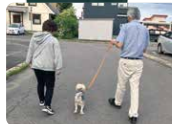
愛犬チャコ(療養中)とサクの2頭の散歩、餌やり、 トイレ掃除などは2人で。