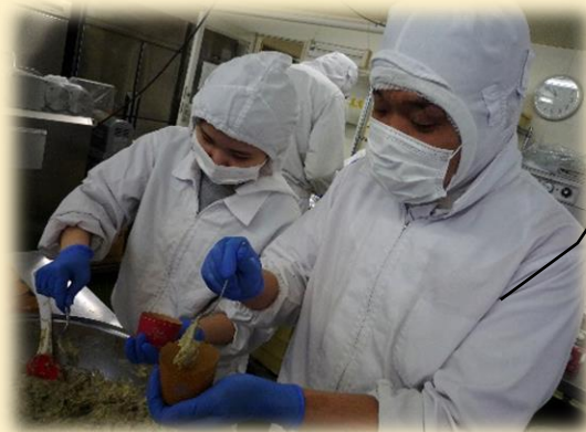
③ カップに生地を入れる

いつものパン作りとは違う お菓子作り。 初めて作る利用者様も あり、真剣なまなざしで ケーキ作りに取り組んでい ます！