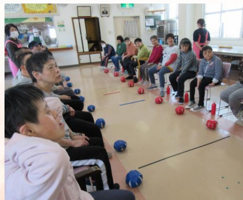
月1回実施している、光南病院の作業療法士による訪問レクリエーションの様子です。この日は足を使ったゲームのチーム戦。身体を動かしながら楽しまれていました！