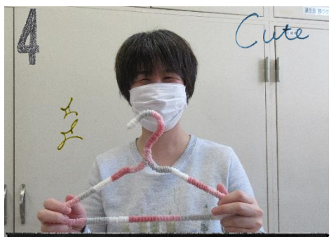
世界でひとつだけのハンガーが完成〜♪

ケアサポート科ではデコレーションハンガーを製作しています。作り方はシンプルで針金ハンガーに毛糸を巻き付けると完成です！衣類が滑りにくくなりますし、何より様々な毛糸を使用する事でカラフルになってとってもかわいいです。 1 本1 本利用者様が時間を掛けて丁寧に製作しています。時折毛糸の間から針金部分が見えてしまうこともあります、それもまたいい味となっております。