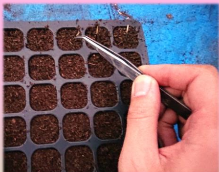
1本ずつ丁寧に植え込みます

今はパレットの上で成長をしているお花ですが、4月にはポット移植を開始し、1本の立派な苗となります。