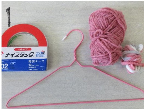
・ハンガー ・両面テープ ・毛糸を用意します。