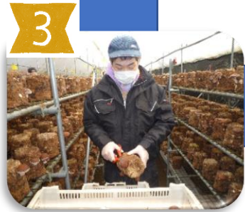
9:30頃には数名で 収穫作業を開始します