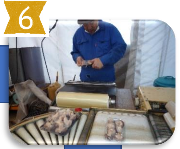
機械と手作業の両方で ラップ掛け作業も進めます