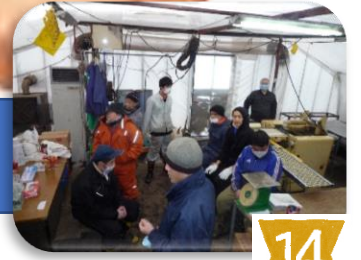
15:30には作業終了と なりはちす園へと戻ります 一日お疲れさまでした〜