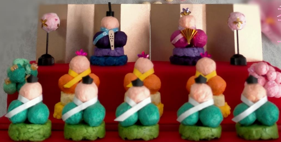
↑3/3のおひなまつりに作成したものです。桃の花をあしらった飾りは一足先に春の訪れを感じさせます。