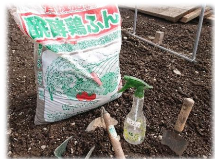
野菜作りの準備も万端です！