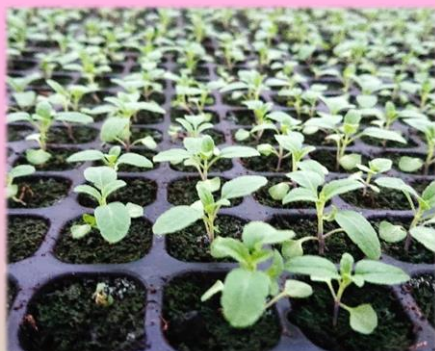
4月現在ではこんなかんじに！