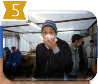
10:30に10分間休憩 お茶で一服します ☺