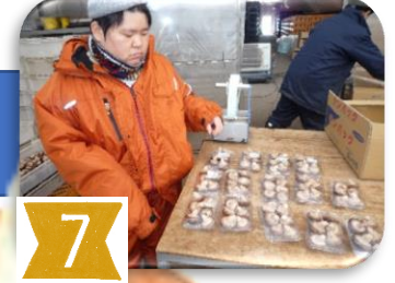
ラップされた椎茸にラベル 貼りと箱詰めをします