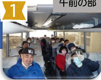
椎茸ハウスへ向かって 出陣だあ〜