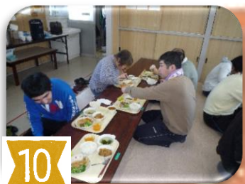
12:00~13:00まで 昼食休憩に入ります