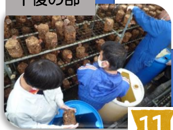
13:20には午後の作業 開始菌床の陳列作業等 をします