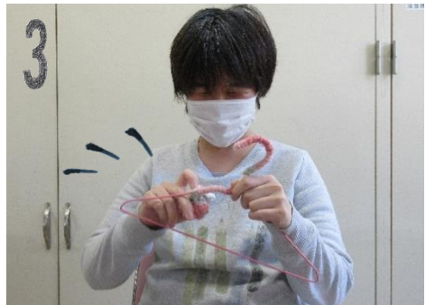
途中で色を変えるなど自分好みにデコレーションをしています。