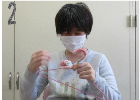
ハンガーに両面テープを張り毛糸を巻いていきます。