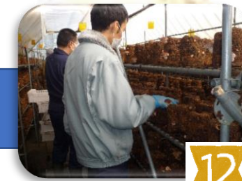
菌床の間隔を取りながら 綺麗に並べて、芽かき作 業も行なっています