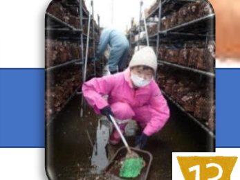
掃き掃除も大事な作業 でハウス内の隅々まで 綺麗にして頂いています