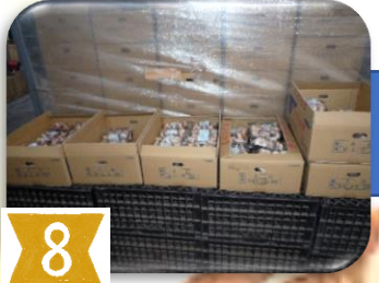
規格別に分けながら 積み上げていきます。