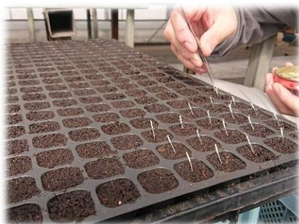
お花の種植え！熟練の技が光ります