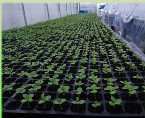
現在の栽培量は約23,000本