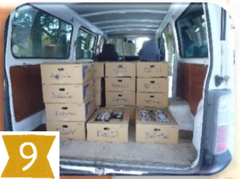
車に積み込んで午後から 市場へ納品に行きます