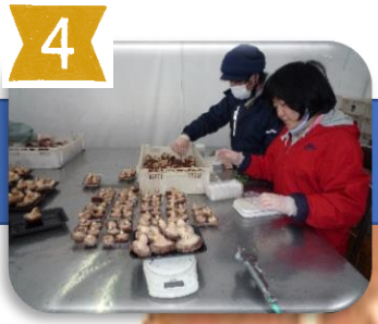
10:15には計量作業も 同時進行していきます