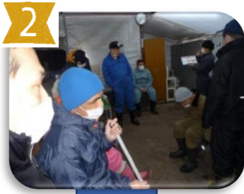
9:25頃には到着、皆さんの 作業配置を伝えます。