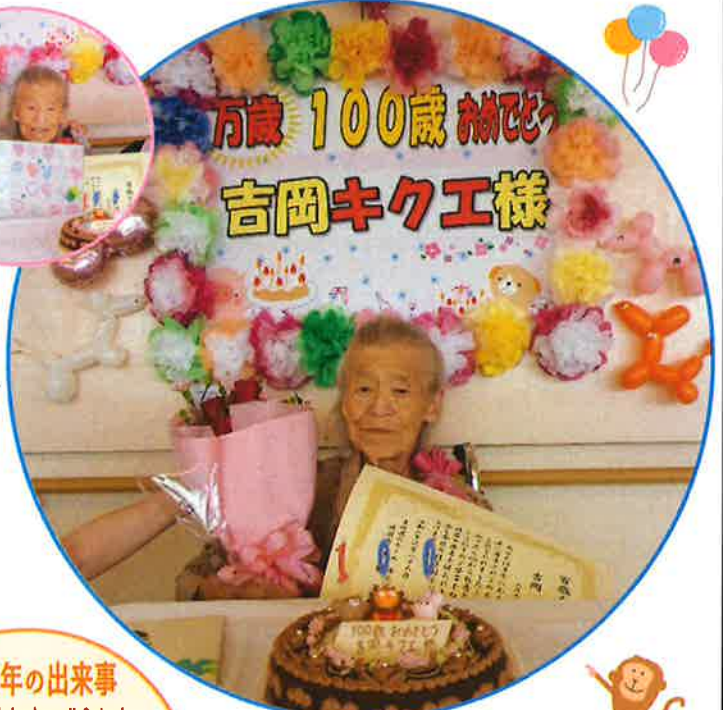
大正9年6月27日生まれ 申年