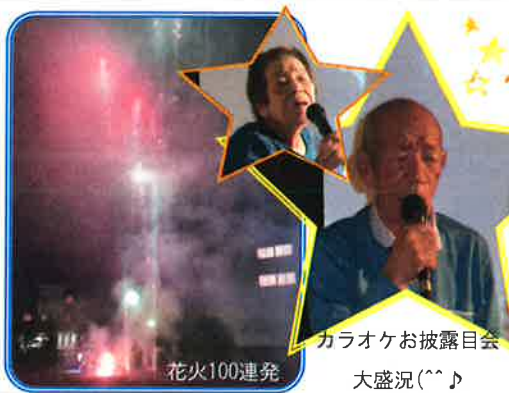
カラオケお披露目会 大盛況(^_^)