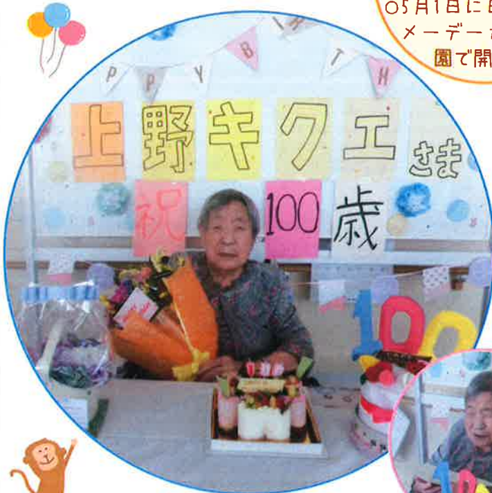
大正9年8月30日生まれ 申年