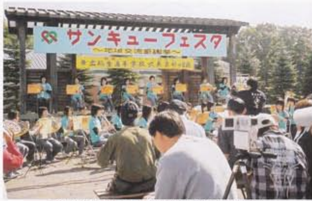
帯広柏葉高等学校吹奏楽部の演奏