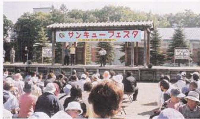
開会式 帯広やわらぎ園