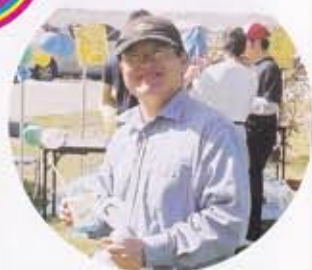
かき氷を手に 笑顔の利用者