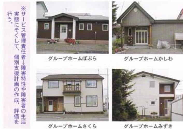
グループホームぼぶら