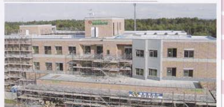
来春開業に向け建設が進む特別養護老人ホーム「帯広慈恩の里」

モデルルーム あすから公開 特養ホーム「帯広慈恩の里」 社会福祉法人真宗協会 や理美容室、ボランテイ（川上直平理事長）は、アのための専用室もあ来月四月、帯広市空港南町。また、特養ホームの町に開設する特別養護老人ホーム「帯広慈恩の里」のモデルルーム（定員百人）内のモデル（定員百人）内のモデル（定員百人）を八日から公開する。入居申し込みは十一月から。 モデルルームの公開は八日から二十五日までの毎週金曜日・翌月曜日で、時間は午前十時から午後三時まで。 問い合わせは真宗協会の運営する帯広信楽会 ☎0165・24・0002（西田美穂）