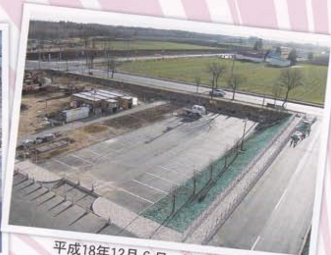
平成18年12月6日 駐車場整備