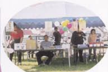
やきそばコーナー