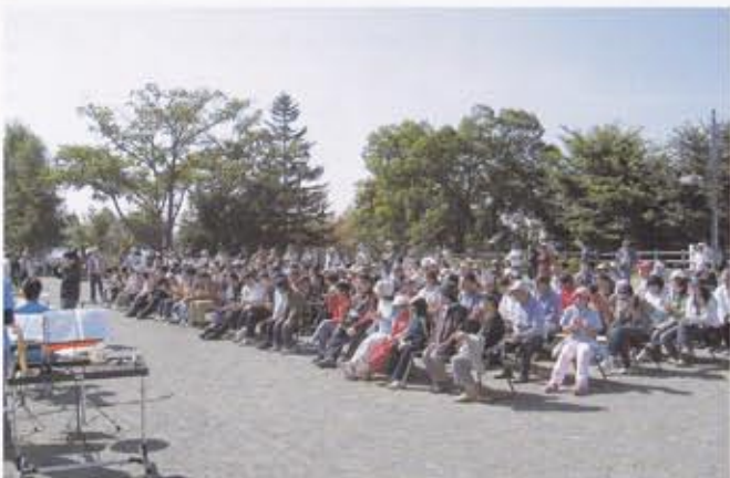
多数参加された市民のみなさん旧大正駅メイン会場