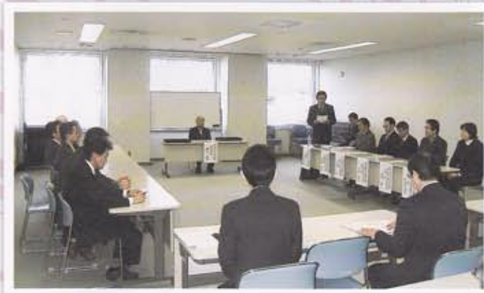
平成18年12月20日 備品及び業務委託入札