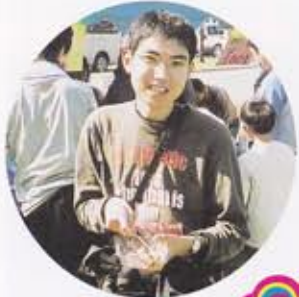
帯広マイトリリー