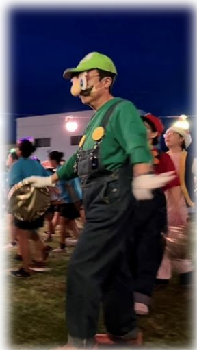
菅原事務局長もノリノリ♪