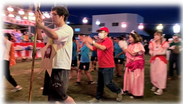
みんな頑張って踊りました★