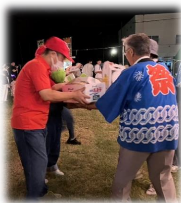
沢山の景品を頂きました！